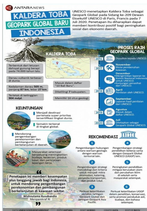
Gambar 2. Geopark Global Baru

sebagian besarnya tidak ada dalam studi geopark akademik. Lanskap geopark secara intristik bernilai juga peningkatan pendidikan meningkatkan kesadaran masyarakat mengenai nilai geopark.