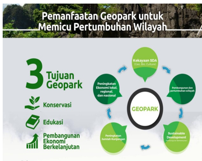
Gambar 3. Tujuan Geopark

Seperti yang kita ketahui wisata Danau Toba merupakan lima destinasi super prioritas yang disiapkan oleh kementerian pariwisata dan ekonomi kreatif (kemenparekraf) dan tersebut mencakup Borobudur, Danau Toba, Likupang, Mandalika, dan Labuhan Bajo. Dan dengan ditetapkannya Danau Toba menjadi Kaldera Global Geopark merupakan suatu hal yang baik dan juga sebuah keuntungan dengan diakuinya Global Geopark tersebut dapat membantu rancangan pemerintah dalam mewujudkan tujuan menjadikan Danau Toba menjadi lima destinasi super prioritas, yang bertujuan dalam membangun pariwisata Kabupaten Toba. Pengembangan Geopark menjadi destinasi wisata berkelas Internasional ialah cita-cita seluruh Geopark di Indonesia, yang sejalan dalam visi UNESCO.