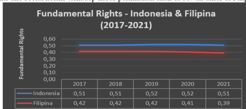
Grafik 3. Indeks Fundamental Rights Indonesia dan Filipina

Berdasarkan data dari WJP, dalam kurun waktu dari tahun 2017-2021 Filipina memiliki capaian tertinggi pada indeks fundamental rights and social norms sebesar 0,42 dari skor maksimal 1 pada tahun 2019.(World Justice Project, 2021b) Maknanya, income group Filipina termasuk pada lower middle atau golongan menengah ke bawah yang menjelaskan bahwa angka penerapan hak asasi masyarakat Filipina belum maksimal hampir sama dengan Indonesia. Sehingga, tidak ada pengaruh yang signifikan antara variabel fundamental rights and social norms terhadap kasus pernikahan anak di bawah umur di Filipina.